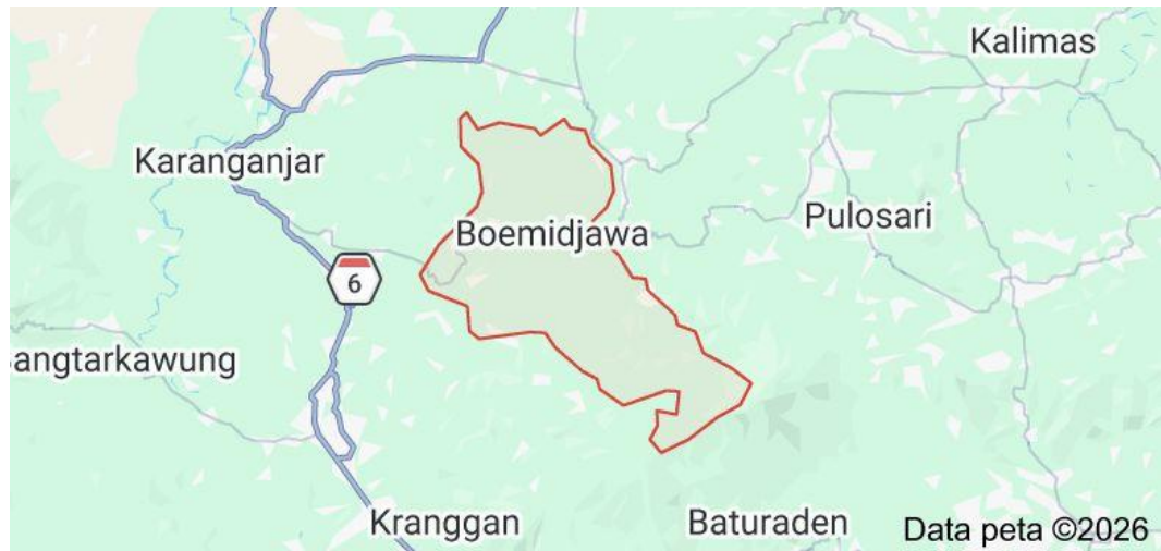
Gambar 2.1 Peta Lokasi Penelitian

hal ini juga di karenakan masyarakatnya memiliki latar belakang pendidikan, pekerjaan, dan tingkat akses pelayanan kesehatan yang beragam.